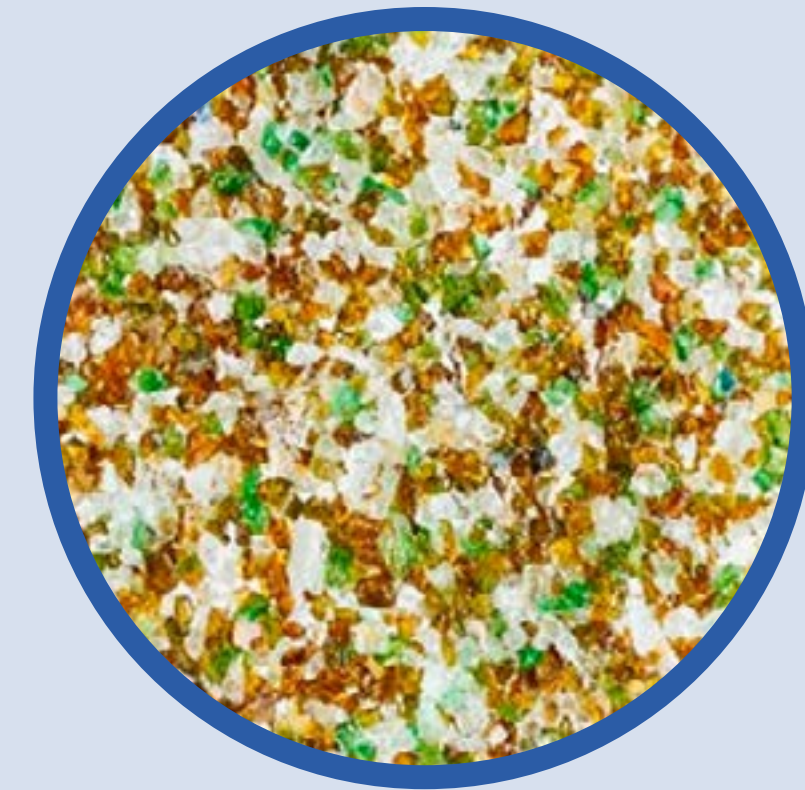
Standard Grado 3 (de 2,5mm a 4,5mm)

Elaboramos otras granulometrías según necesidad del cliente