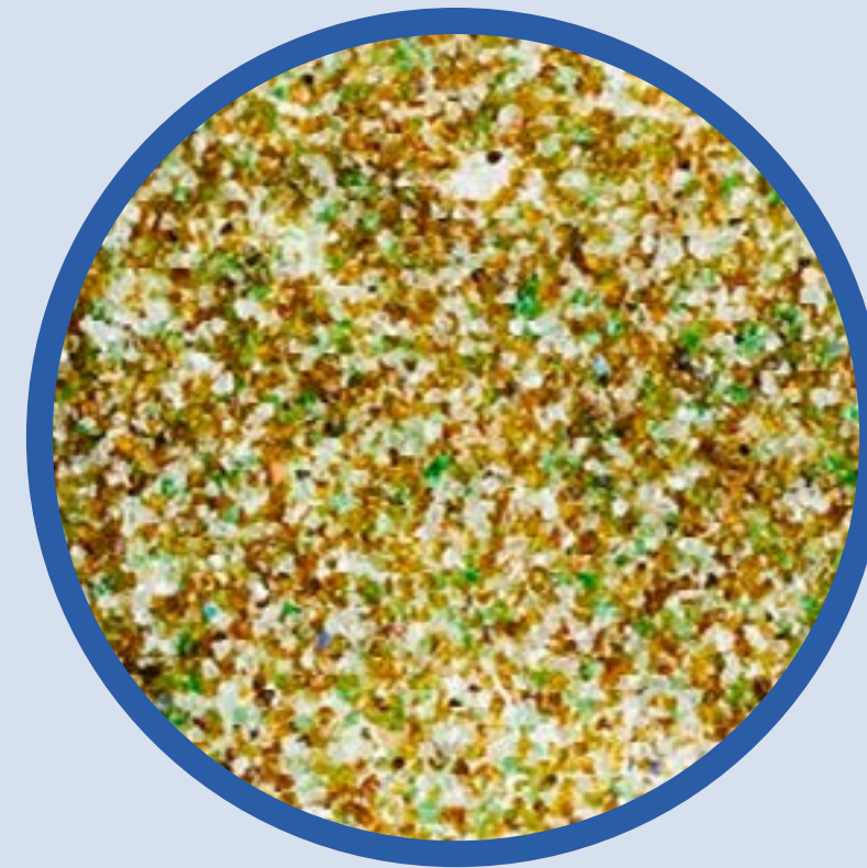
Standard Grado 2 (de 1,5mm a 2,5mm)